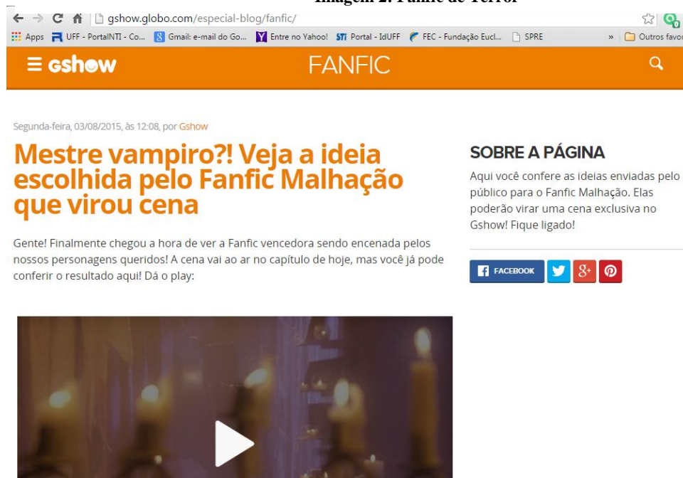
Imagem 2: Fanfic de Terror

Como há um risco na manipulação, já que não se sabe se o outro sujeito irá aceitá-la, e, caso a aceite, como irá proceder, visto que se trata de um sujeito do querer e não um sujeito programado, a estratégia adotada pelos produtores visa também ter algum controle sobre a criação dos conteúdos por parte dos fãs, para que se possa encaixar a fanfic vencedora na trama de modo coerente: eram dadas regras e temas sobre os quais o público deveria criar uma história. Foram dois os temas dados, um de cada vez: sonho de romance e sonho de terror. O fã deveria seguir os princípios de implantação do universo figurativo, não acrescentando nenhum personagem novo à história e não poderia mandar sua fanfic dividida em partes. O concurso foi realizado, as duas vencedoras foram escolhidas e foram ao PROJAC acompanhar a gravação das cenas escritas por elas.